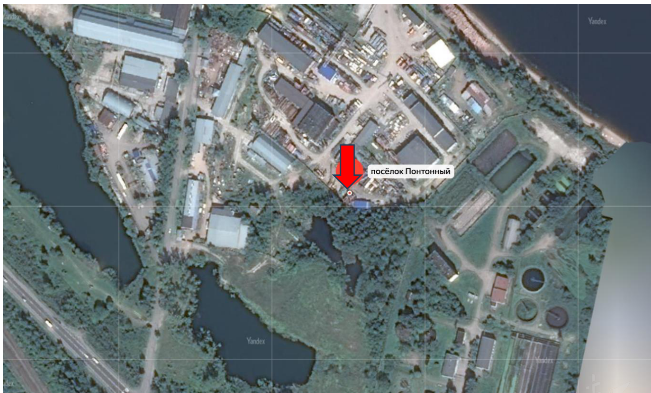
Рисунок 3 – Местоположение оцениваемого земельного участка на карте города