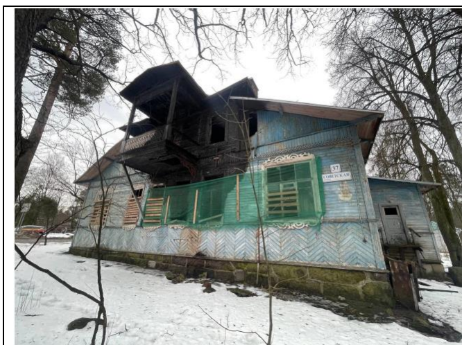
Фото 1. Вид на здание размещения Объекта оценки с Советской улицы.