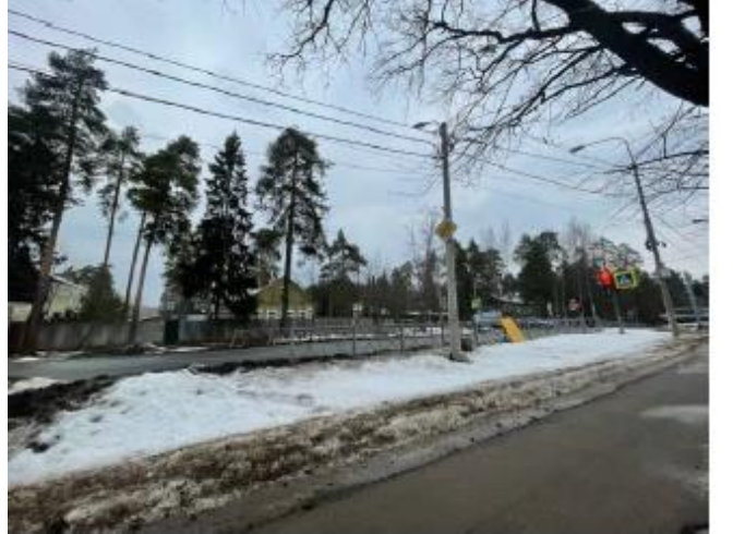
Фото 6. Ближайшее окружение Объекта оценки. Вид на Советскую улицу.