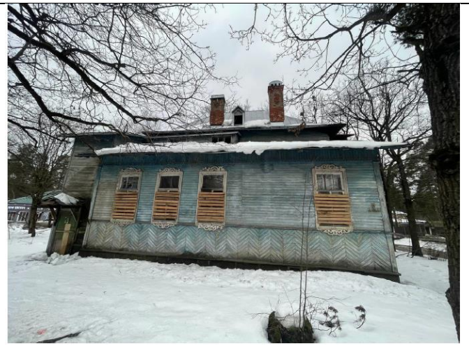
Фото 4. Вид на здание размещения Объекта оценки с Ленинградской улицы