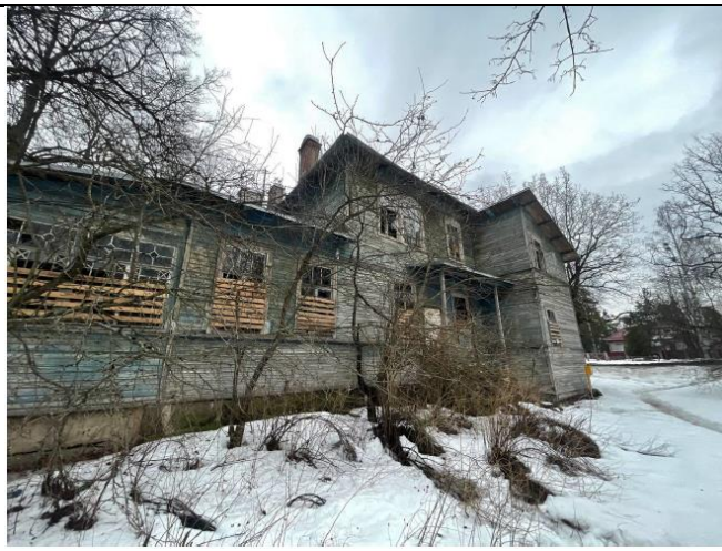
Фото 3. Вид на здание размещения Объекта оценки со двора.