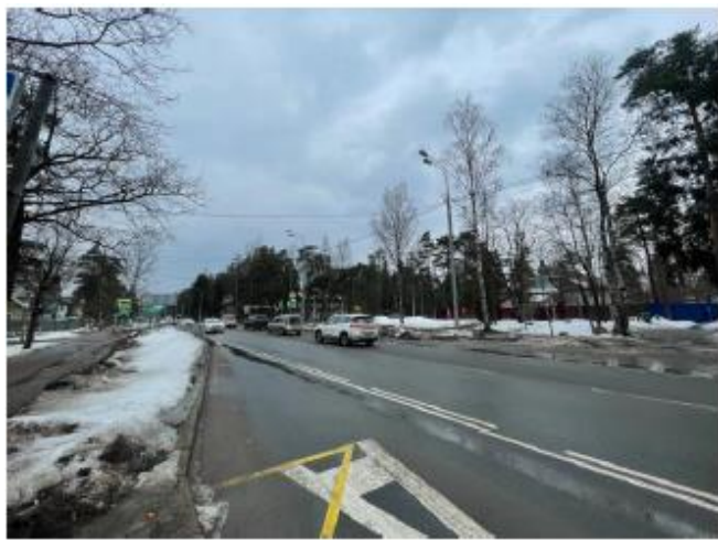
Фото 5. Ближайшее окружение Объекта оценки. Вид на Ленинградскую улицу.