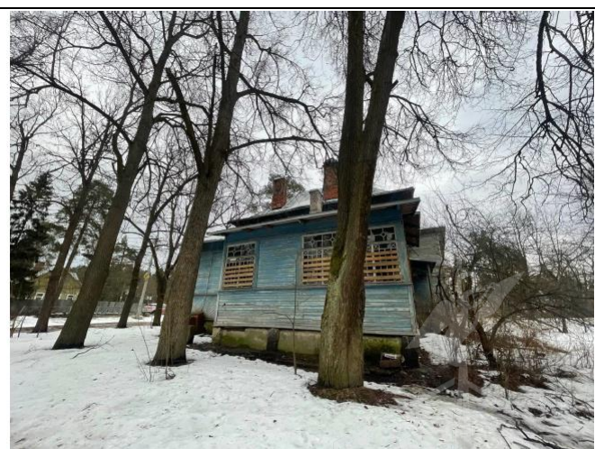
Фото 2. Вид на здание размещения Объекта оценки со двора.