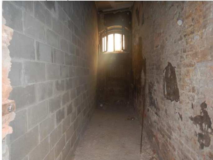
Фото №4 (ч.п.1)