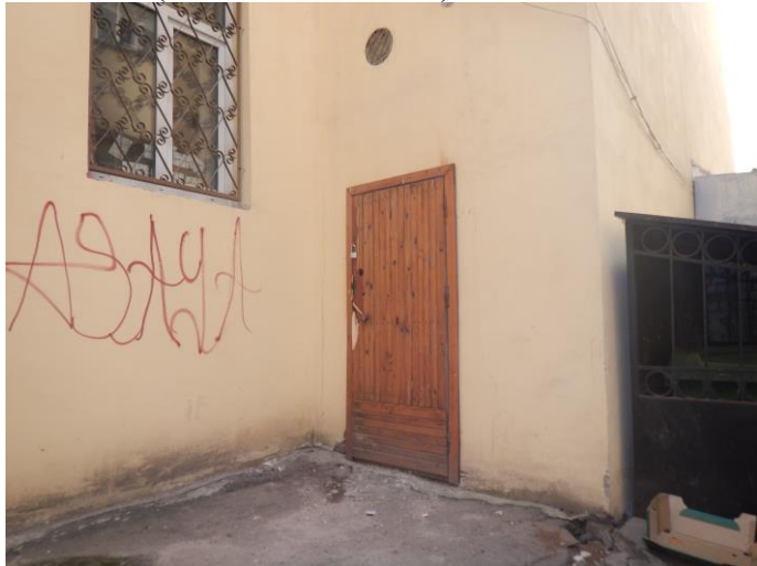
Фото №3 (вход в помещение)